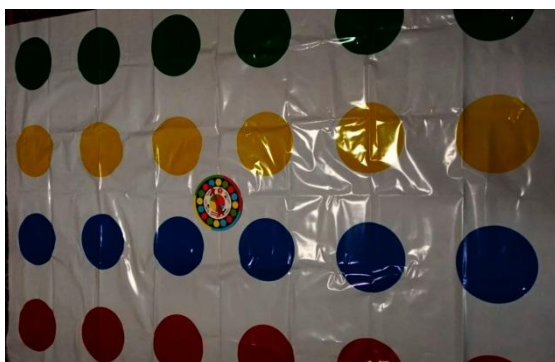
левую или правую